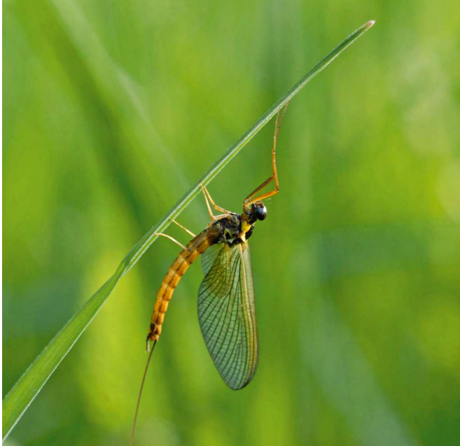
■ L'espèce Metreletus balcanicus , classée "Quasi menacée", est victime de l'intensification des pratiques agricoles, de la mise en culture de terrains en tête des bassins versants et localement du curage de ruisseaux temporaires et de fossés.