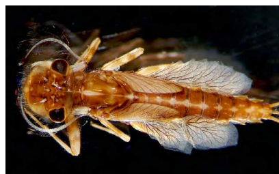
■ Larve d' Arthroplea congener , une espèce rare classée "En danger critique", sensible à l'impact du drainage et du pompage qui modifient les niveaux hydriques et assèchent les cours d'eau, ainsi qu'à l'exploitation forestière.

effluents industriels, dont ceux des eaux de refroidissement des centrales nucléaires, menacent particulièrement les éphémères. C'est le cas également des effluents dus aux activités touristiques saisonnières, comme dans les campings ou les stations de montagne, aux structures d'épuration parfois sous-dimensionnées. L'exploitation forestière altère aussi la qualité du milieu, lorsqu'elle repose sur des essences modifiant l'acidité des sols. Enfin, ces espèces liées aux eaux douces subissent l'impact des usages de l'espace à grande échelle, comme le lessivage des sols dû à l'agriculture intensive, le drainage des terres cultivées et l'extension des surfaces urbaines imperméabilisées.