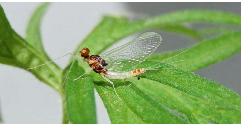
■ Serratella mesoleuca , une espèce de la Loire "En danger" et en déclin, menacée par l'aménagement des cours d'eau, l'entretien par dragage, l'artificialisation des berges et le rejet d'eau chaude des centrales nucléaires, qui altèrent la qualité de son habitat.

Transformant la matière végétale (principalement des algues microscopiques) en matière animale, les éphémères se situent à la base de la chaîne alimentaire. Ils sont la proie d'un grand nombre d'animaux qui consomment aussi bien les larves que les adultes : libellules, punaises d'eau, poissons, oiseaux ou encore chauves-souris. Du fait de leur respiration aquatique assurée par des branchies, les larves sont particulièrement fragiles à la pollution et à l'élévation de la température. Ces insectes sont ainsi de très bons bio-indicateurs de la qualité des milieux d'eau douce.