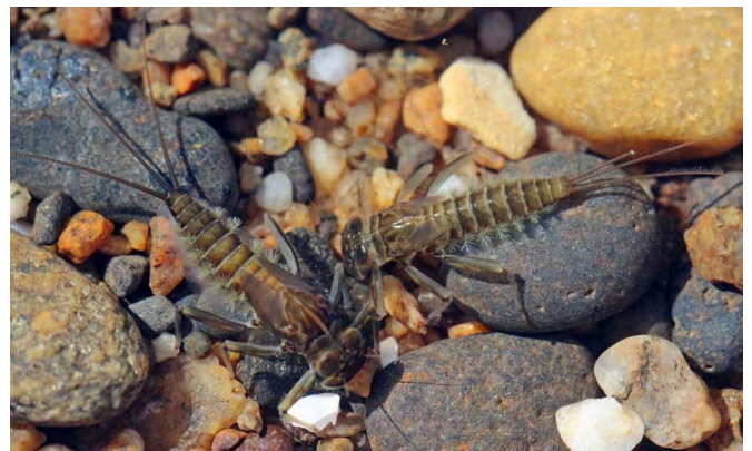
■ Larves de Rhithrogena germanica , une espèce classée "Vulnérable" et en régression, menacée par l'urbanisation et la pollution.

La Liste rouge nationale permet de mesurer le degré de menace pesant sur chacune des espèces présentes en France. L'état des lieux a été mené par le Comité français de l'UICN et le Muséum national d'Histoire naturelle, en partenariat avec l'Office pour les insectes et leur environnement. Les analyses se sont appuyées sur les connaissances et les compétences du groupe "Opie-benthos", dédié à l'étude des insectes aquatiques. Pour chaque espèce, toutes les informations disponibles ont été compilées et examinées. La validation collégiale des résultats est intervenue lors d'un atelier d'experts organisé en février 2018, au cours duquel la catégorie de chaque espèce a été déterminée selon la méthodologie de l'UICN. Le bilan synthétique de ces évaluations est présenté ci-dessous.