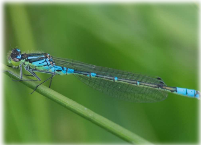
Agrion à lunules ( Coenagrion lunulatum )

Cette Liste Rouge des Odonates fait suite à une première évaluation validée par le Conseil scientifique régional du patrimoine naturel (CSRPN) en février 2004. L'évaluation se fonde sur les données disponibles, nuancées parfois par les avis des experts. Le risque d'extinction peut être légèrement sous ou surévalué. C'est pourquoi, une réactualisation régulière de ce travail est prévue afin de pouvoir affiner le statut des espèces au regard de l'évolution des connaissances.